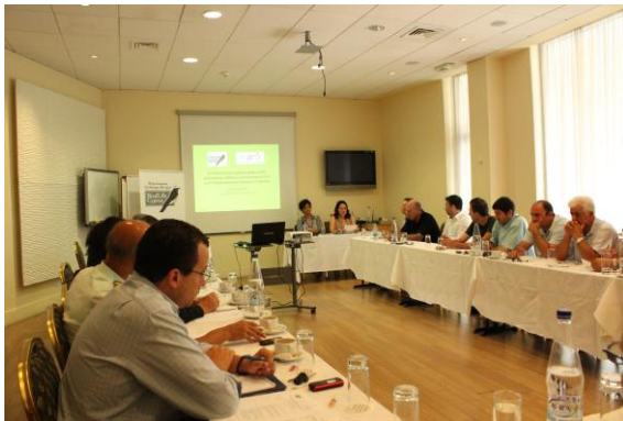
Στιγμιότυπο από την Ημερίδα

Το βασικό συμπέρασμα της ημερίδας ήταν ότι πρέπει να προχωρήσει μία μελέτη για τις εναλλακτικές λύσεις για τους μελισσοφάγους στα μελίσσια και στην Κύπρο, ώστε η τεχνογνωσία από το εξωτερικό να δοκιμαστεί στην Κύπρο.