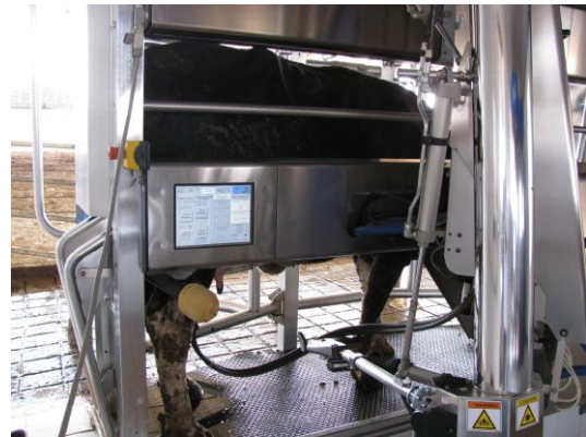
Καινοτόμες αγροτικές εκμεταλλεύσεις στην Κύπρο.