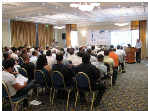
Στιγμιότυπο από την Ημερίδα