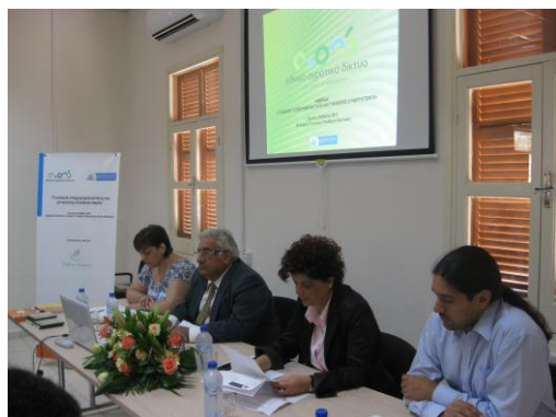
Στιγμιότυπο από την Ημερίδα

Σε ποσοστό 95% οι συμμετέχοντες συμφωνούν ότι οι ομιλητές ήταν καλοί γνώστες του αντικείμενου για το οποίο μίλησαν, 90% συμφωνούν ότι οι ομιλητές κατάφεραν να μεταφέρουν τις γνώσεις τους. Όσον αφορά το γεγονός αν οι ομιλητές ήταν προετοιμασμένοι για να απαντήσουν στις οποιοσδήποτε ερωτήσεις των συμμετεχόντων το 95% συμφωνεί απόλυτα.