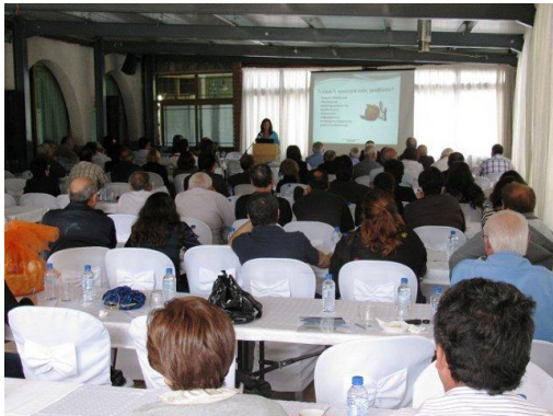
Στιγμιότυπο από την Ημερίδα

Η Αναπτυξιακή Εταιρεία Κοινοτήτων Περιοχής Τροόδους ανέφερε ότι τα αποτελέσματα που είχαν τεθεί κατά το σχεδιασμό της Δράσης έχουν επιτευχθεί σε μέγιστο βαθμό. Τα ποσοστά ήταν τα εξής: Για το Περιεχόμενο Προγράμματος 75,41%, για τους Μεθόδους Κατάρτισης 88,52%, για την Οργάνωση Κατάρτισης 77,87%, για τους Ομιλητές 80,60% και για την επίτευξη των στόχων της ημερίδας 80%.