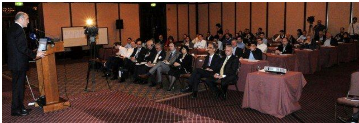
Στιγμιότυπο από το Συνέδριο

Το Συνέδριο πραγματοποιήθηκε στις 30 Μαρτίου 2011, στο ξενοδοχείο Hilton Park, στη Λευκωσία .