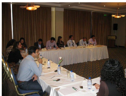
Στιγμιότυπα από τη συνάντηση των Ομάδων Τοπικής Δράσης