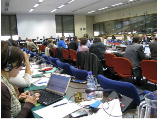
Στιγμιότυπα από συνεδριάσεις της Συντονιστικής Επιτροπής του Ευρωπαϊκού Δικτύου για την Αγροτική Ανάπτυξη

Το ΕΑΔ συμμετέχει επίσης στα πιο κάτω σεμινάρια: