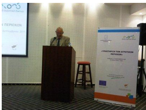
Στιγμιότυπο από τον χαιρετισμό του Υπουργού Γεωργίας, Φυσικών Πόρων και Περιβάλλοντος και Σοφοκλή Αλετράρη

Όσον αφορά τους ομιλητές, το 92% από όσους συμπλήρωσαν το ερωτηματολόγιο συμφωνούν ότι ήταν οργανωμένοι και προετοιμασμένοι και κατάφεραν να μεταδώσουν τις γνώσεις τους στους συμμετέχοντες.