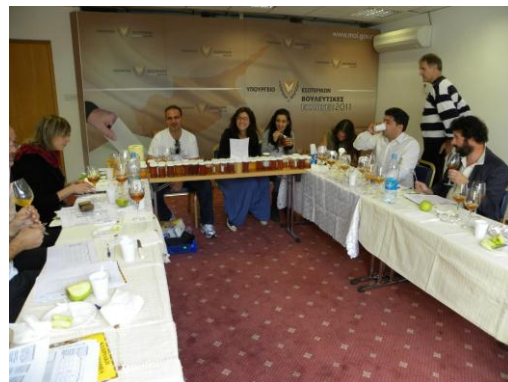
Στιγμιότυπα από το Συνέδριο και από τον 1ο Παγκύπριο Διαγωνισμό Κυπριακού Μελιού