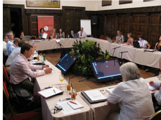
Στιγμιότυπα από συναντήσεις Εθνικών Αγροτικών Δικτύων

Το ΕΑΔ συμμετέχει επίσης στη Συντονιστική Επιτροπή του Ευρωπαϊκού Δικτύου για την Αγροτική Ανάπτυξη και στην υποεπιτροπή Leader.